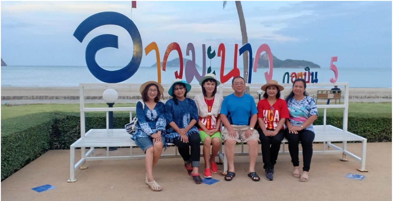
วันที่ ๘ - ๙ พฤษภาคม ๒๕๖๒ เจ้าหน้าที่โรงเรียนอนุบาลสามเสนฯ ศึกษาดูงาน ณ จังหวัดประจวบคีรีขันธ์