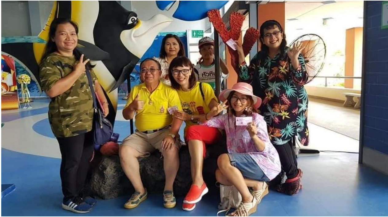
วันที่ ๘ - ๙ พฤษภาคม ๒๕๖๒ เจ้าหน้าที่โรงเรียนอนุบาลสามเสนฯ ศึกษาดูงาน ณ จังหวัดประจวบคีรีขันธ์